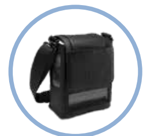
Bolsa portadora del Inogen One G5* Modelo n.º CA-500