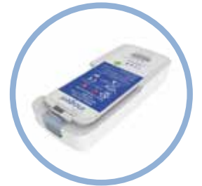
Batería de iones de litio del Inogen One G5* Hasta 6,5 horas de funcionamiento Modelo n.º BA-500