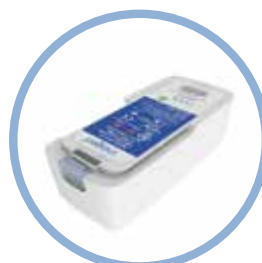
Batería de iones de litio de larga duración del Inogen One® G5 Hasta 13 horas de funcionamiento Modelo n.º BA-516