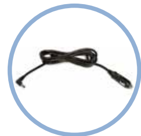
Cable de alimentación de CC del Inogen One G5* Modelo n.º BA-306