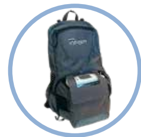
Mochila del Inogen One G5** Modelo n.º CA-550